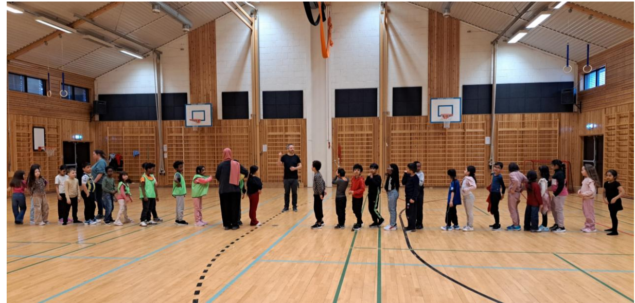
Skolens fotball cup.