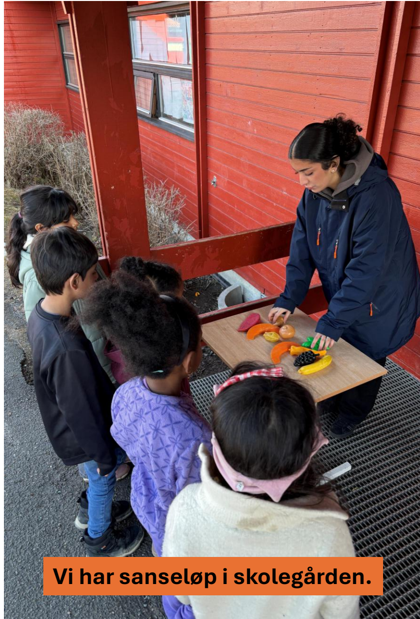
Vi har sanseløp i skolegården.