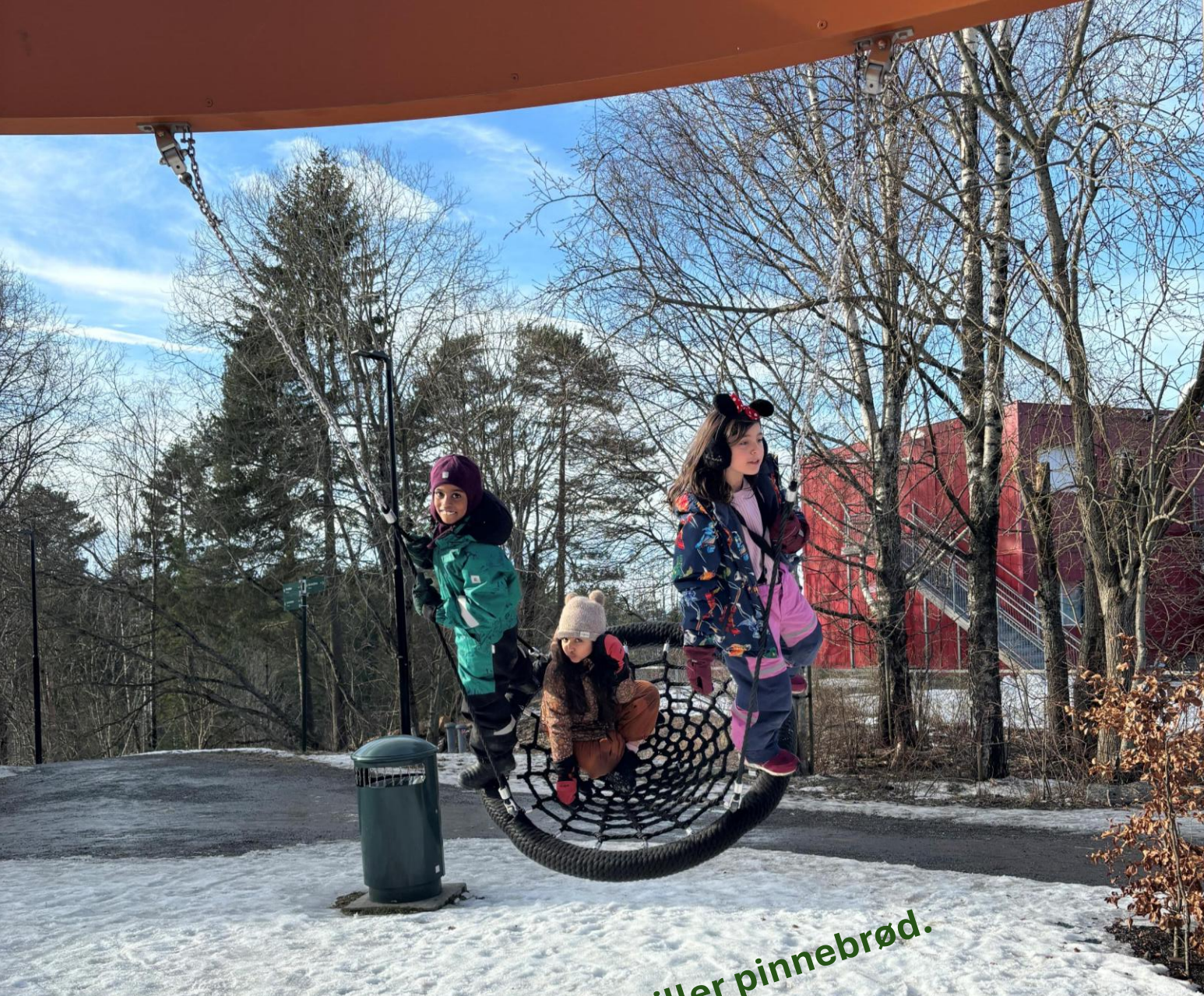
Vi griller pinnebrød.