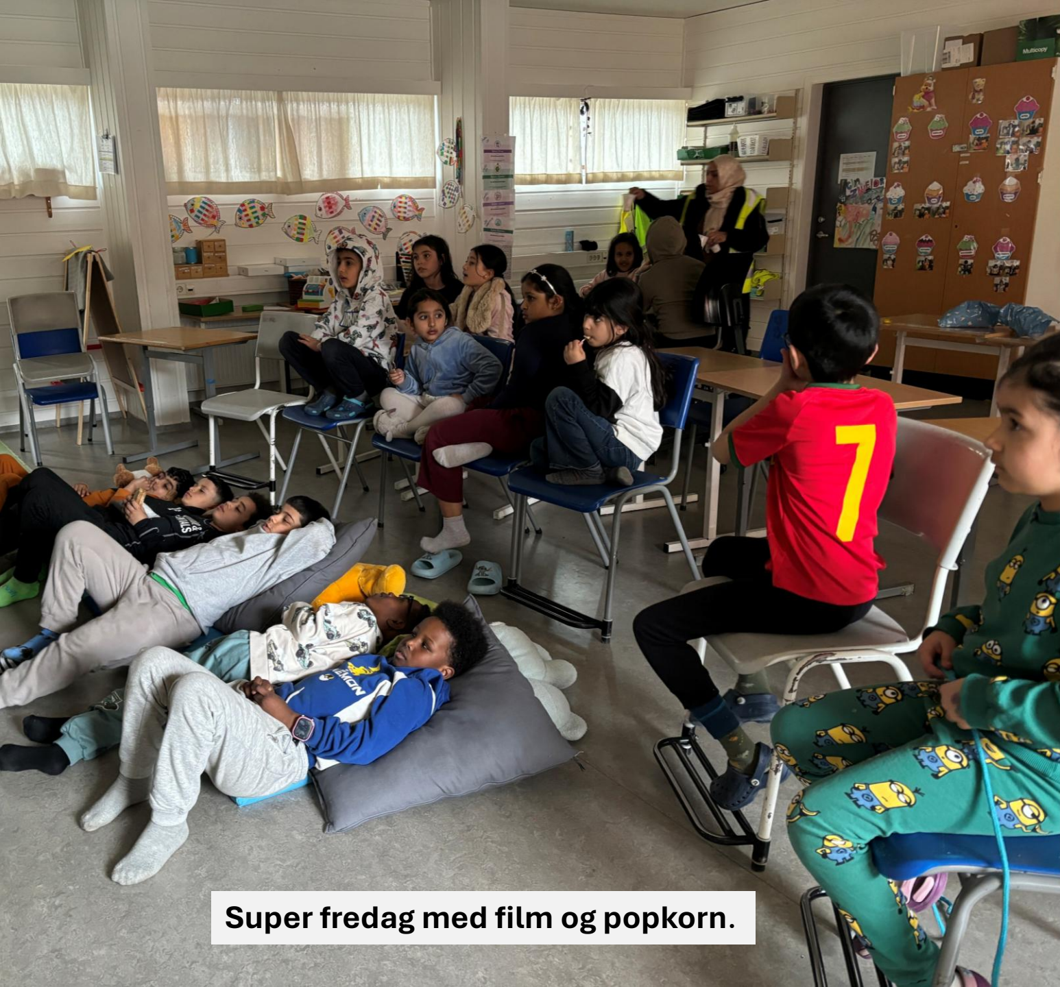
Super fredag med film og popkorn.